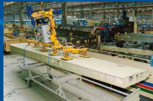
Vacuum beam for aluminium plate application

无论金属板的轻重，真空吊具可以在保证板材完整性的同时，安全地将其运送到指定位置，尤其是对于一些非常昂贵的产品来说更为重要