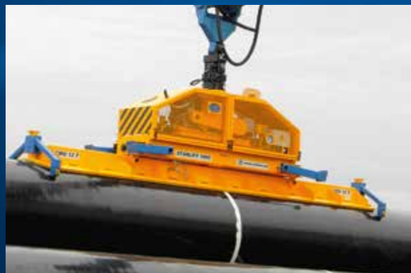
Vacuum system for pipe

无论在工厂还是管道现场安装，使用真空吸盘搬运长管及现场对接更加容易，可以到达精心搬运，对表面无任何伤害。