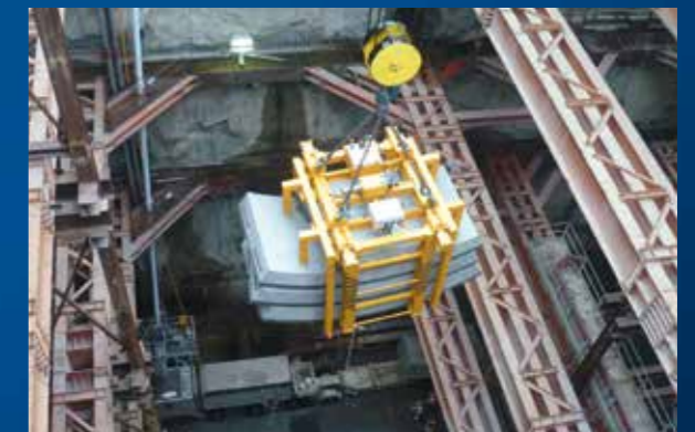
Self-powered hydraulic clamp

ACIMEX 在高精度大体量的混凝土管片领域经验丰富。近20年以来，ACIMEX吸盘吊具广泛应用于隧道预制管片行业，已经向全世界销售了500多台真空设备，用于不同尺寸隧道管片的吊运及拼装。