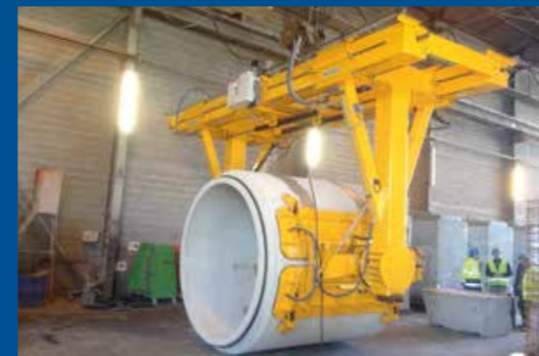
Demoulding turning beam